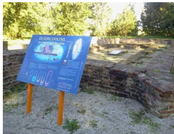
Figuur 4.6 Informatiebord van het Flevo Landschap op Schokland.

Ten slotte blijkt uit een onderzoek uit 2015 van de Universiteit Utrecht dat fietsen daadwerkelijk tot een betere gezondheid en verlengde levensduur leidt. Voor elk gefietst uur leeft men gemiddeld een uur langer. Daarnaast leidt fietsen tot een betere luchtkwaliteit, verminderde verkeersdrukke en een verminderde ziektelast doordat mensen meer bewegen. Om deze redenen wordt het de politiek van harte aanbevolen meer te investeren in het verbeteren en uitbreiden van het fietsnetwerk.