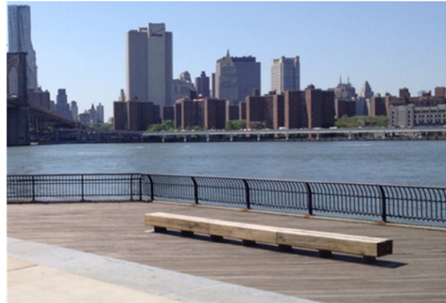
Figuren 4.3 & 4.4 & 4.5: Voorbeelden van bankjes tafels informatieborden

Ook zal er gekeken worden naar het type informatiepaneel dat langs de fietsroute geplaatst kan worden. In Nederland zijn verschillende informatieborden te vinden (zie figuren 4.5 & 4.6).