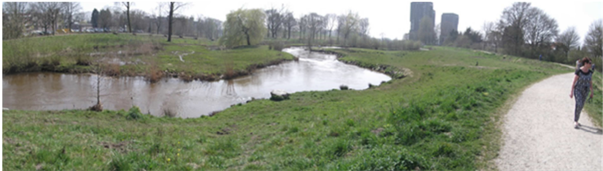
De Aa of Weerijis in het Zaartpark (Breda).

Onze strategie houdt in dat het draagvlak verbreed wordt, naamsbekendheid aan het nieuwe fietspad wordt gegeven en voor de aankleding van de route geld wordt gevonden. We gaan subsidiemogelijkheden laten onderzoeken en donateurs en sponsors proberen te vinden.